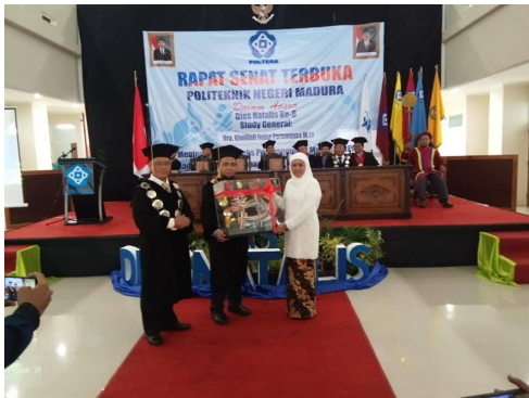
Dies Natalis Politeknik Negeri Madura dihadiri oleh Gubernur Jawa Timur Dra. Hj. Khofifah Indar Parawansa, M.Si.