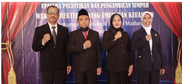
Jajaran Direksi Politeknik Negeri Madura