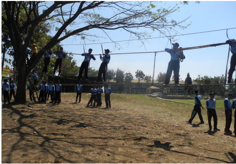
Kegiatan Kedisiplinan, Kewiraan dan Wawasan Kebangsaan Mahasiswa Baru POLTERA