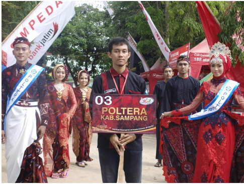
Mahasiswa Poltera tampil dalam rangka HUT Kabupaten Sampang