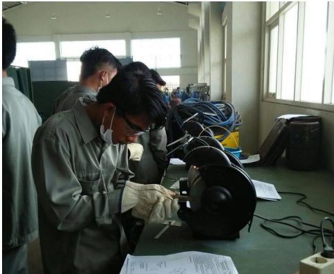
Praktek Bengkel Mahasiswa POLTERA