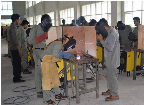
Praktek Pengelasan Mahasiswa POLTERA