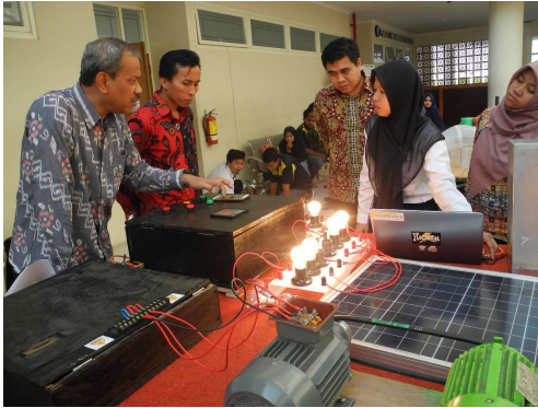
Pameran Tugas Akhir Mahasiswa TLI Politeknik Negeri Madura