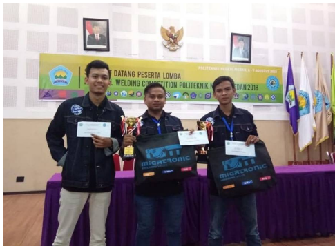
Juara National Welding Competition di Politeknik Negeri Madura